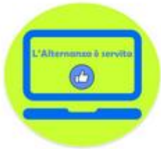
L'ALTERNANZA E' SERVITA