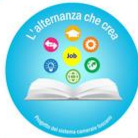
L'ALTERNANZA CHE CREA